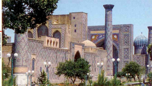
Registan de Samarkand.